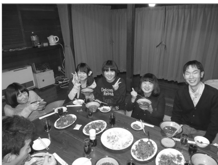
グループでの食事作りや交流

フレッシュャーズキャンプは子どもたちを対象に支援活動をおこなっている、チャンス・フォー・チルドレンが新入生のために本気を出して企画するキャンプです。新入生がこのキャンプに参加し、新しい友達を作り、交流の輪を広げるきっかけ作りにもなります。大学時代にできた仲間とのつながりは人生の財産になること間違いなし。私たちは自信をもって新入生の皆さんにこのキャンプをオススメします。