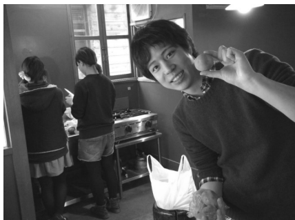
仲間と一緒に食事