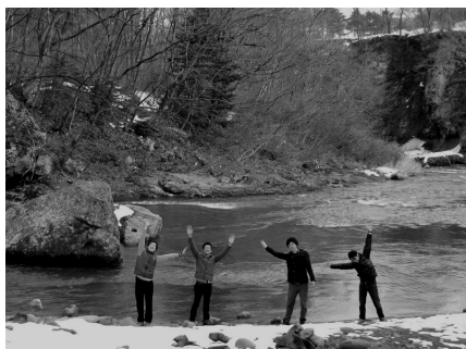
大自然のなかで思いっきり遊ぶ!

このキャンプにはチャンス・フォー・チルドレンで活動するメンバー達も数多く参加しています。新入生10名ほどが一つのグループとなり、料理作りなどのプログラムを行います。昼間は思いっきり自然のなかで身体を動かし、夜は仲間達と熱く語り合う。たった1泊のキャンプですが、それだけとは思えないような濃密な時間が待っています。慌たしい日常生活のなかでは気づかずにいた自分自身の声や思いに静かに耳を傾けることができる時間と環境がキャンプ場にはあります。