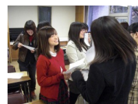
コミュニケーション実習 (養成研修の様子)

養成研修に参加し、被災した子どもとの面談を行う大学生ボランティアを対象に、フォローアップ研修を開催します。フォローアップ研修では、養成研修よりも発展的なコミュニケーション実習や面談でのアドバイスなど、より実践的なことを学ぶことができます。養成研修、フォローアップ研修への参加は必須となります。(フォローアップ研修は、7/19、27に同内容の研修を2回実施します。いずれかご都合のよい方にご参加ください。)