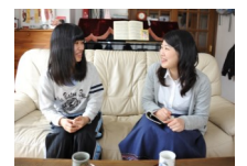
研修終了後は 実際に子どもと面談