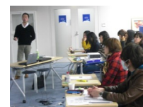
専門講師による講義 (養成研修の様子)